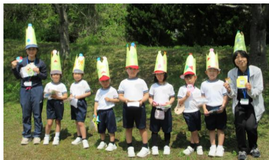
みんなからプレゼントをもらったよ