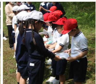
プレゼントをどうぞ