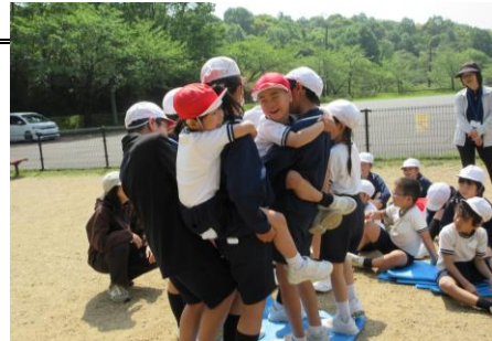
ゲーム「ブルーシート島」

みんなでなかよく遊んで, おいしいお弁当をおなかいっぱい食べて, そして一人一人のよさややさしさがたくさん集まって, 笑顔あふれる遠足になりました。