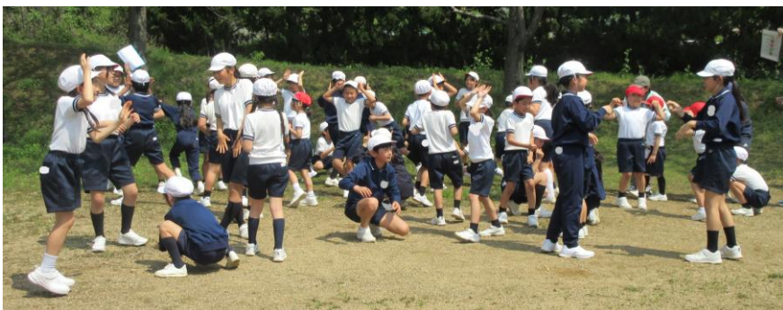
ゲーム「進化じゃんけん」