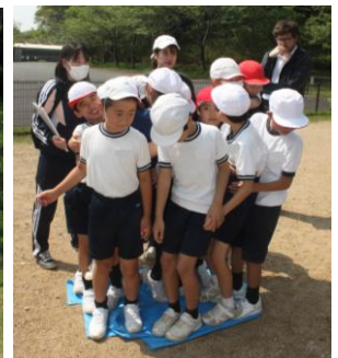
ゲーム「ブルーシート島」